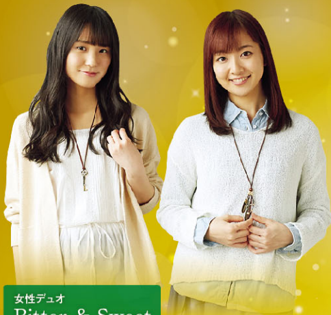
女性デュオ Bitter & Sweet (ビターズウィート)