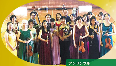
アンサンブル 新潟ARS NOVA (新潟 アルス ノーヴァ)