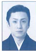
市川染五郎改め松本幸四郎