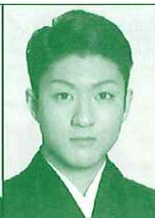
なかむら はし の すけ 中村橋之助