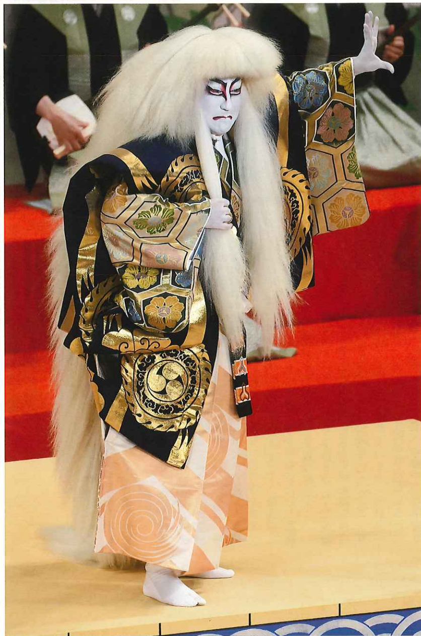
〔連獅子〕中村芝翫