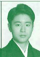
なかむら うた の すけ 中村歌之助