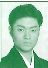
なかむら ふく の すけ 中村福之助