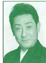
なかむら し かん 中村芝翫