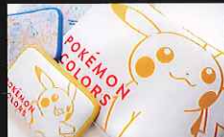
ポーチ(ピカチュウ・總柄) (大)各3,300円(小)各1,650円

*写真はイメージです。*物販コーナーは、入場券をお持ちでない方もご利用いただけます。