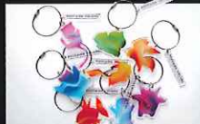
アクリルキーホルダー(全9種) 各1,100円