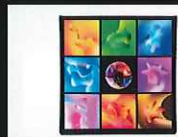
アートデリキービジュアル 4,400円

ポケモンたちのもつ「COLOR」を特徴的にあしらった商品や、当企画独自デザインのモンスターボールにフィーチャーした商品など、およそ160点の企画オリジナル商品を販売!