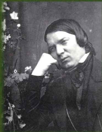
R. シューマン (1810-56)

曲目 J.S. バッハ作曲:《W.F. バッハのためのクラヴィーア小曲集》より プレアンブルム BWV772, 《A.M. バッハのクラヴィーア小曲集》より メヌエット BWV Anh.114, コラール BWV 299 R.シューマン作曲:《子供のためのアルバム》Op.68 (抜粋), 《小さな子供と大きな子供のための12の連弾作品》Op.85 (抜粋), 《若者のための歌のアルバム》Op.79 (抜粋)