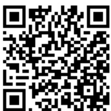
Youtube 演奏動画 QRコード

ベルギーの音楽家一家に生まれる。リェージュでイラストを学んだ後、歌に専念し、モンス王立音楽院で修士号を取得。2023年にケルン音楽大学大学院古楽科声楽課程を最優秀で卒業。17世紀音楽に深い関心を持ち、イタリアやドイツのバロック音楽を探求。柔らかく澄んだ歌声は、コンサートで高い評価を受けている。